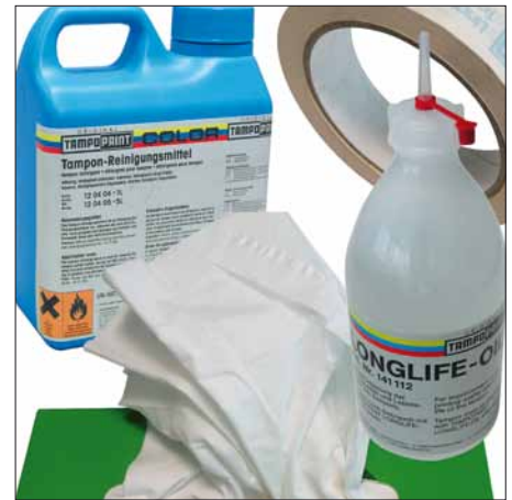
Imagen: Consumibles para el cuidado del tampón

¡Reservado el derecho a realizar modificaciones! ©Copyright