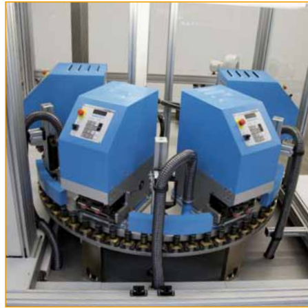
Exemple de combinaison "Top Spin LC" (Impression circulaire) + "Speed Modul" (Impression en face) Impression de LongCaps (bouchons).