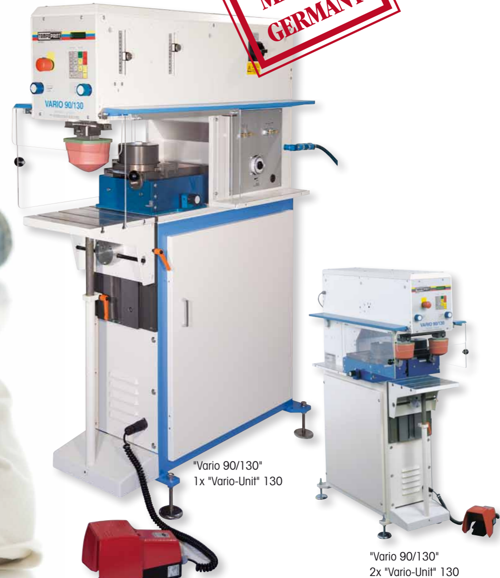
"Vario 90/130" 1x "Vario-Unit" 130